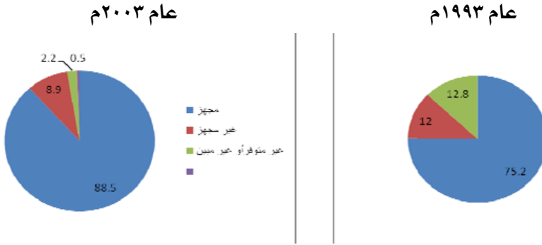
شكل رقم (٣): توزيع المساكن التقليدية المسكونة حسب توفر المرحاض ونوعه

أما بالنسبة إلى توفر الحمام فقد ارتفعت نسبة المساكن التقليدية من ٨٨٪ إلى ٩٨٪ خلال الفترة (١٩٩٣-٢٠٠٣م)، ويصنف الحمام حسب نوعه إلى مجهز وهو إذا كان بداخله حنفيه متصلة بمصدر مغذ للمياه ووسيلة للصرف الصحي، وغير مجهز إذا وجد بالمسكن حمام ولم يكن به حنفيه متصلة بمصدر للمياه وإنما يتم إحضار المياه إليه بوسيلة أخرى، ولو اتصل بوسيلة للصرف الصحي.